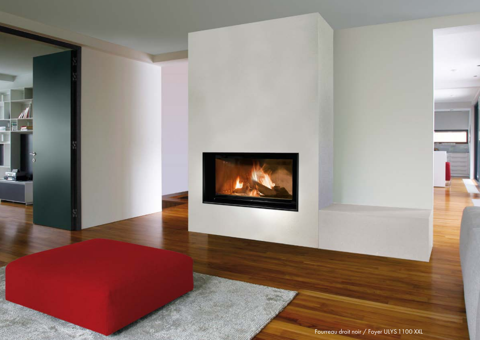
Fourreau droit noir / Foyer ULYS 1100 XXL