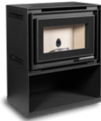
Casier en acier