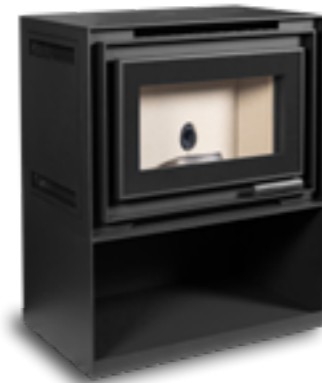
Casier en acier