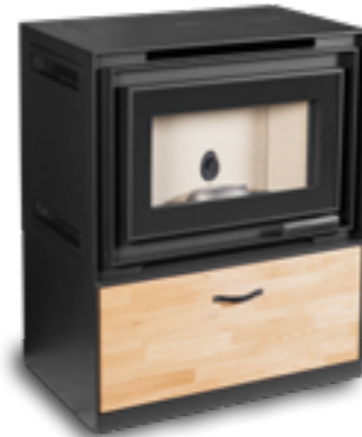
Casier en acier et tiroir bois