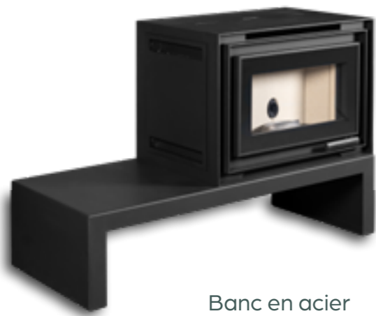
Banc en acier

Le choix du socle est une décision essentielle : il donne du caractère à votre poêle et signe l'élégance de votre intérieur.