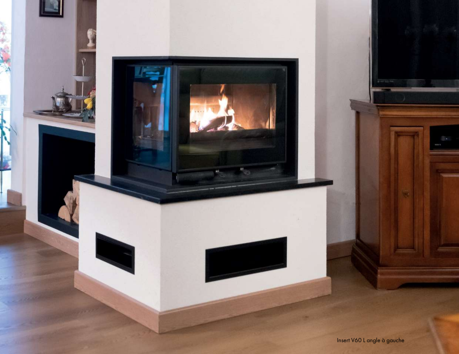
Insert V60 L angle à gauche