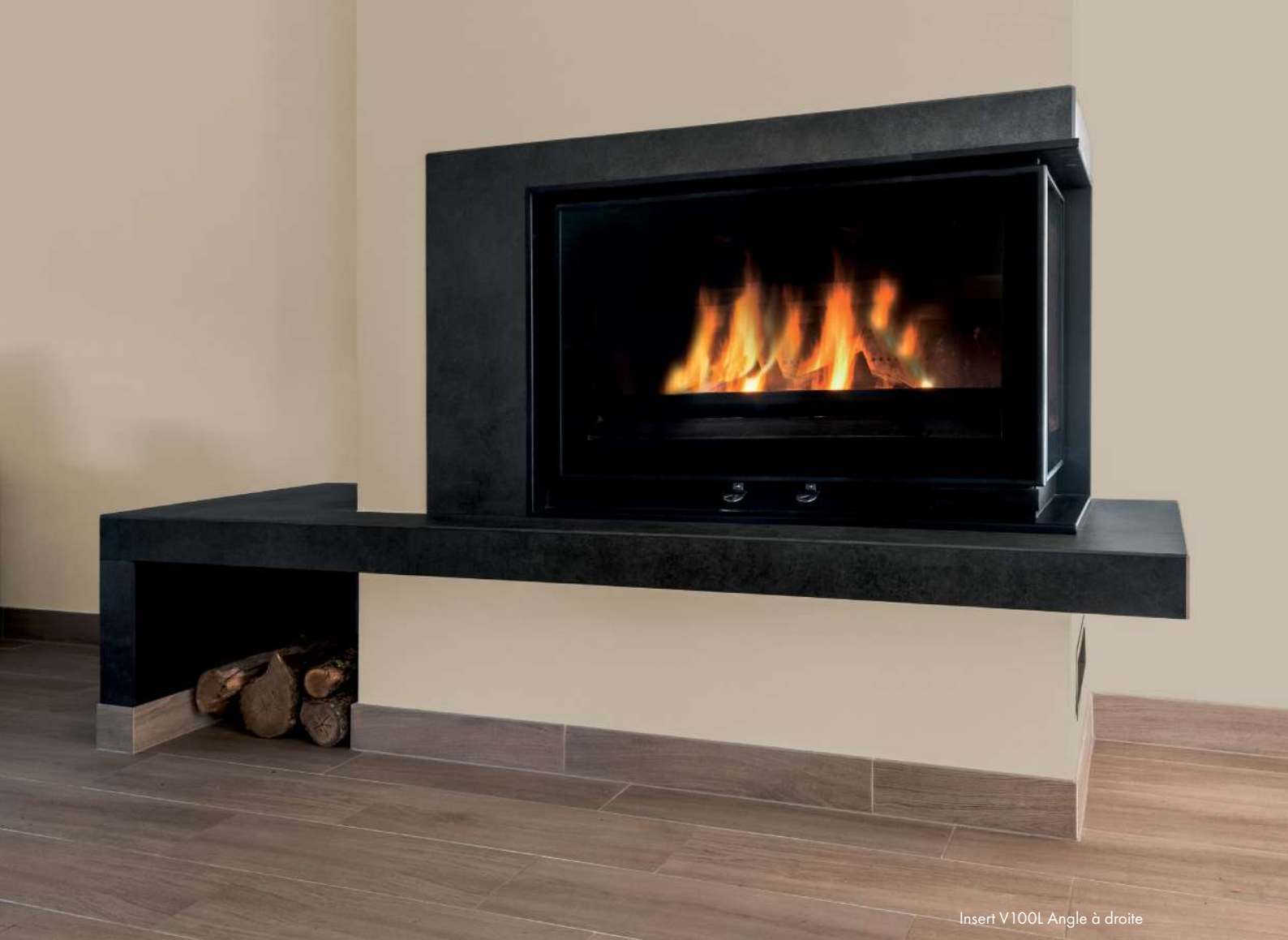
Insert V100L Angle à droite