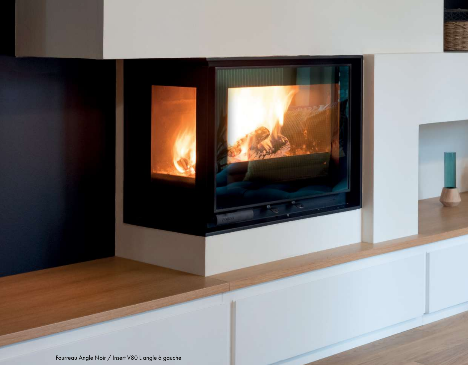
Fourreau Angle Noir / Insert V80 L angle à gauche