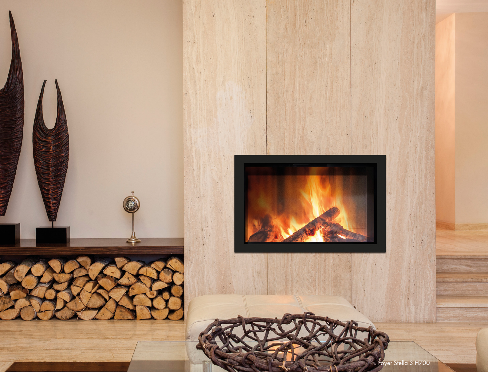
Foyer Stella 3 H700