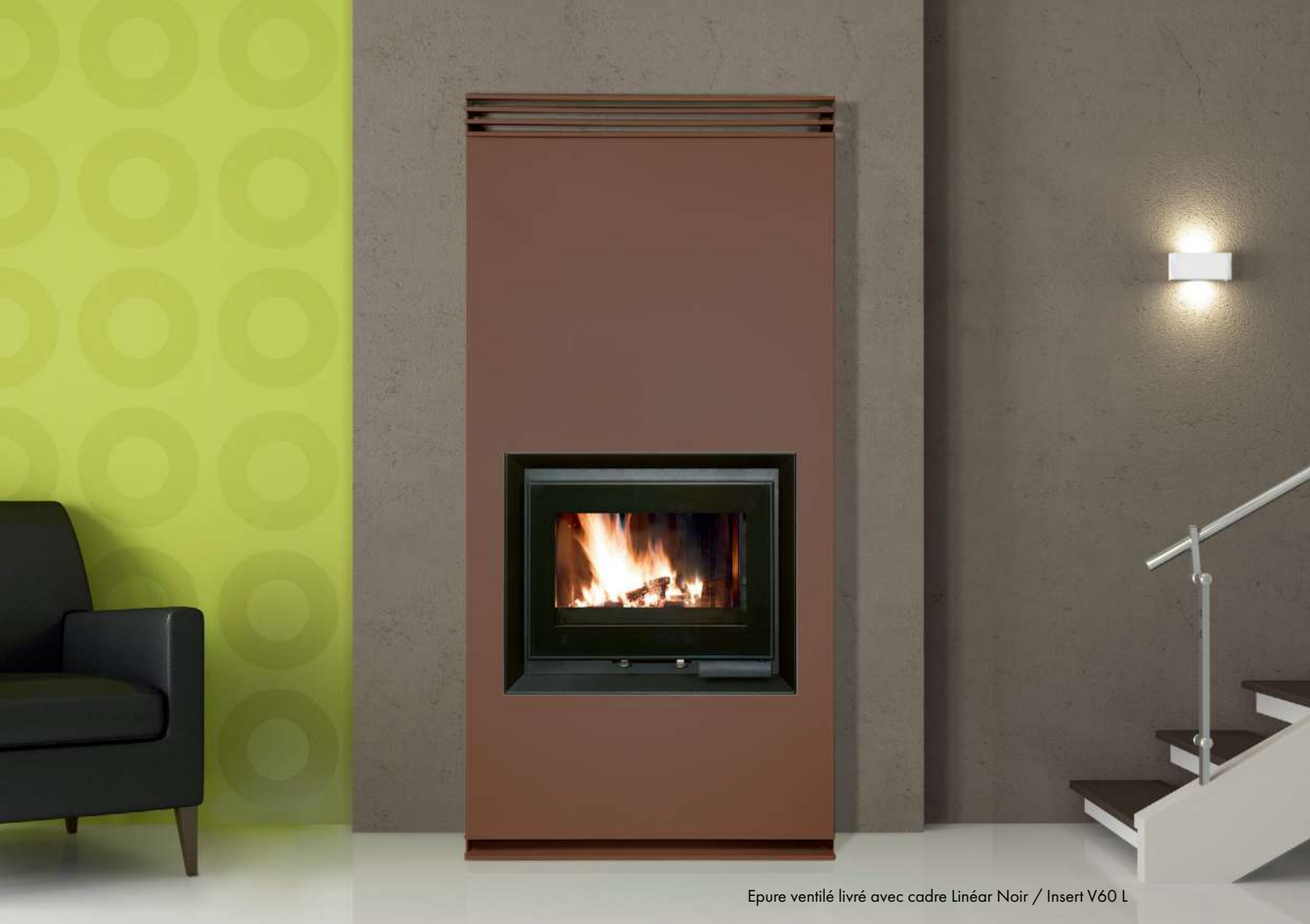
Epure ventilé livré avec cadre Linéar Noir / Insert V60 L