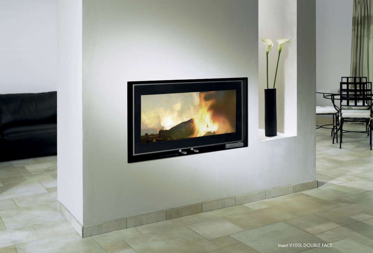
Insert V100L DOUBLE FACE