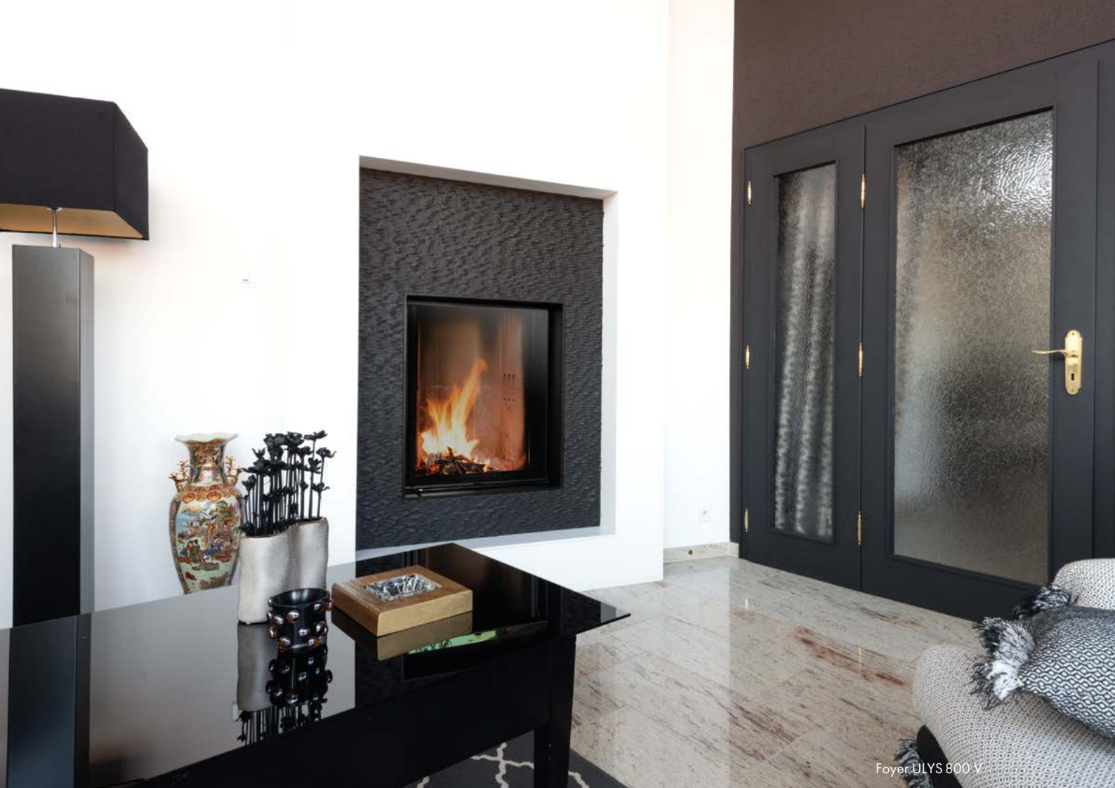
Foyer ULYS 800 V