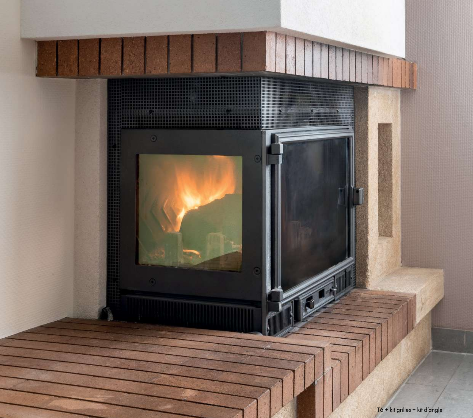
T6 + kit grilles + kit d'angle