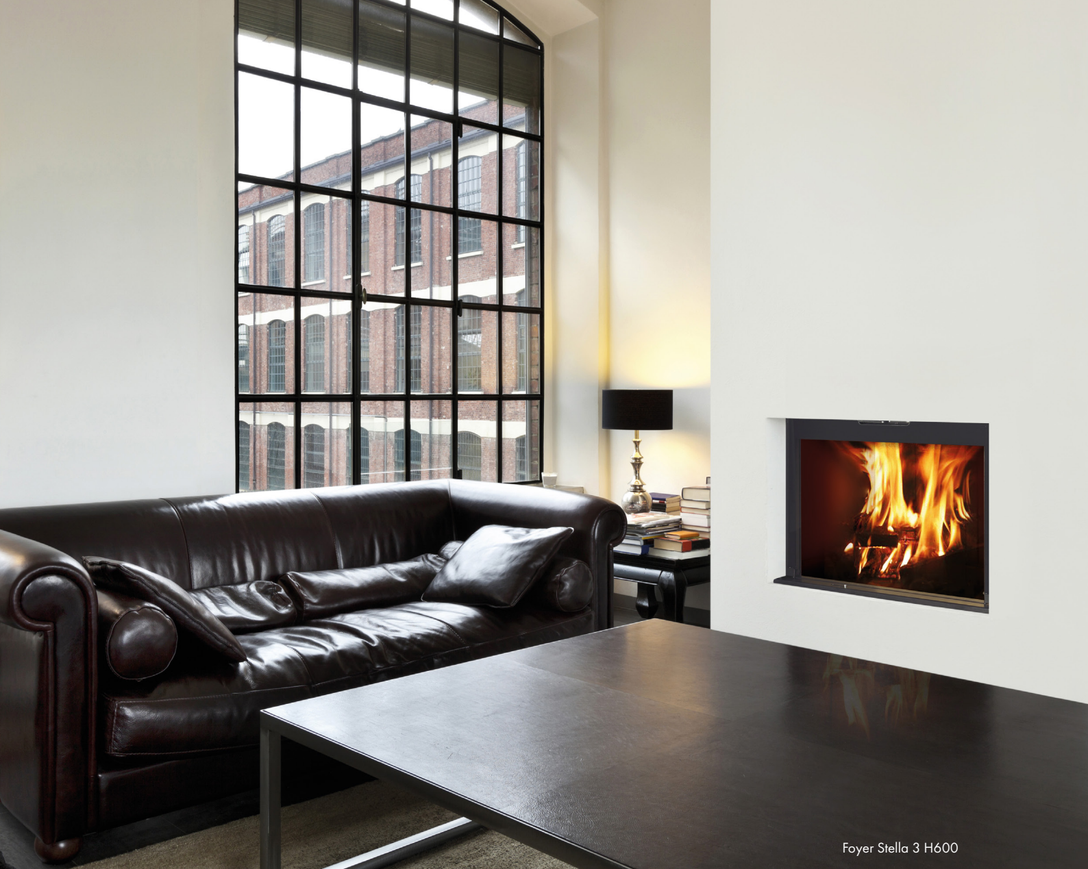
Foyer Stella 3 H600