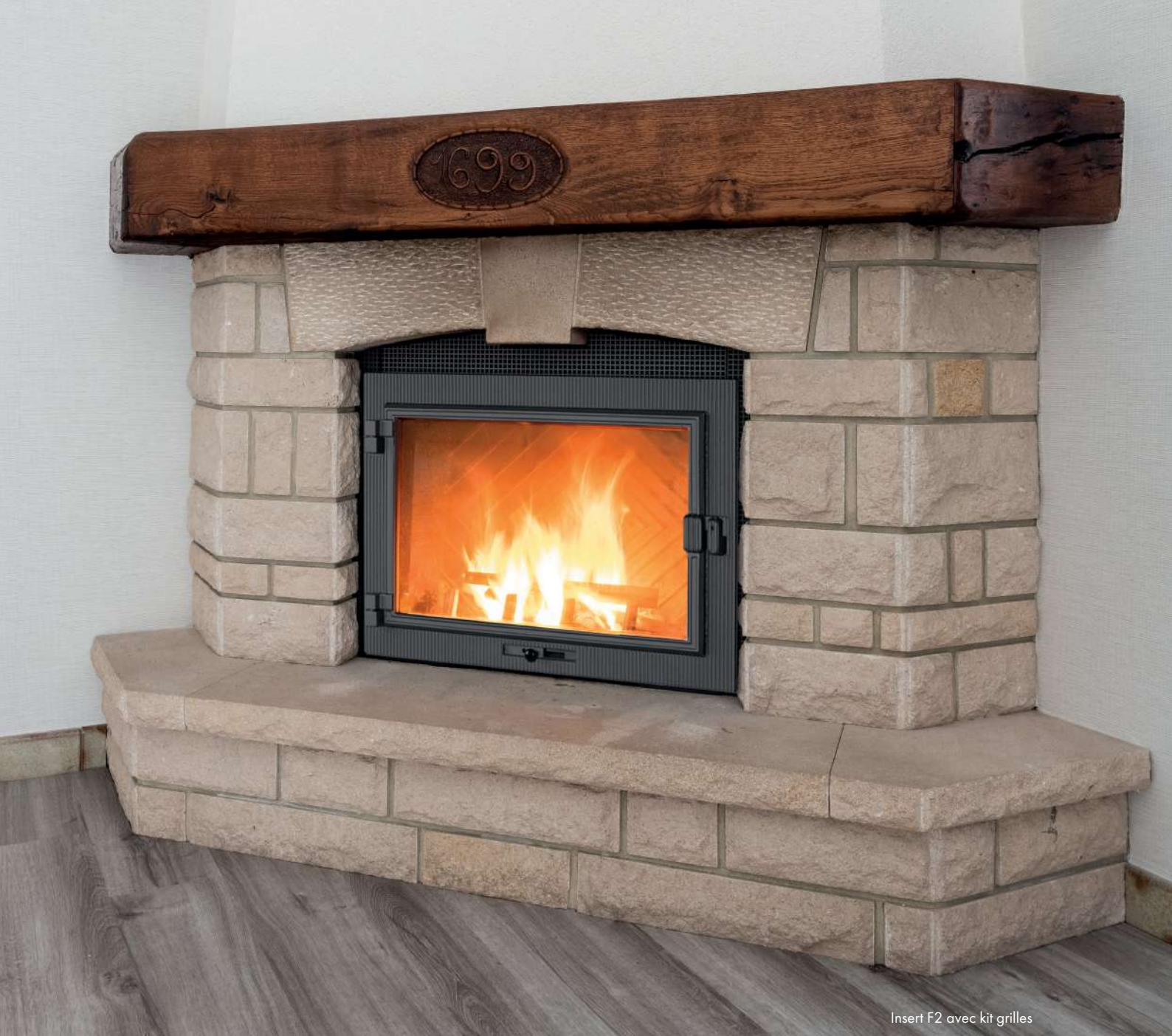
Insert F2 avec kit grilles