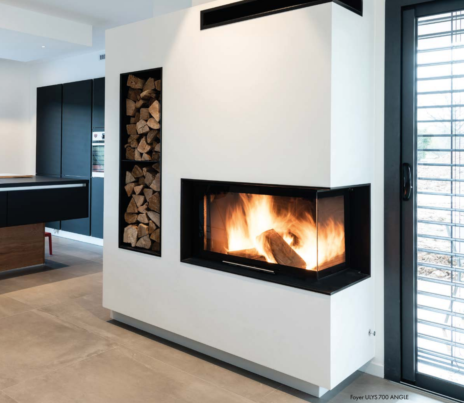
Foyer ULYS 700 ANGLE