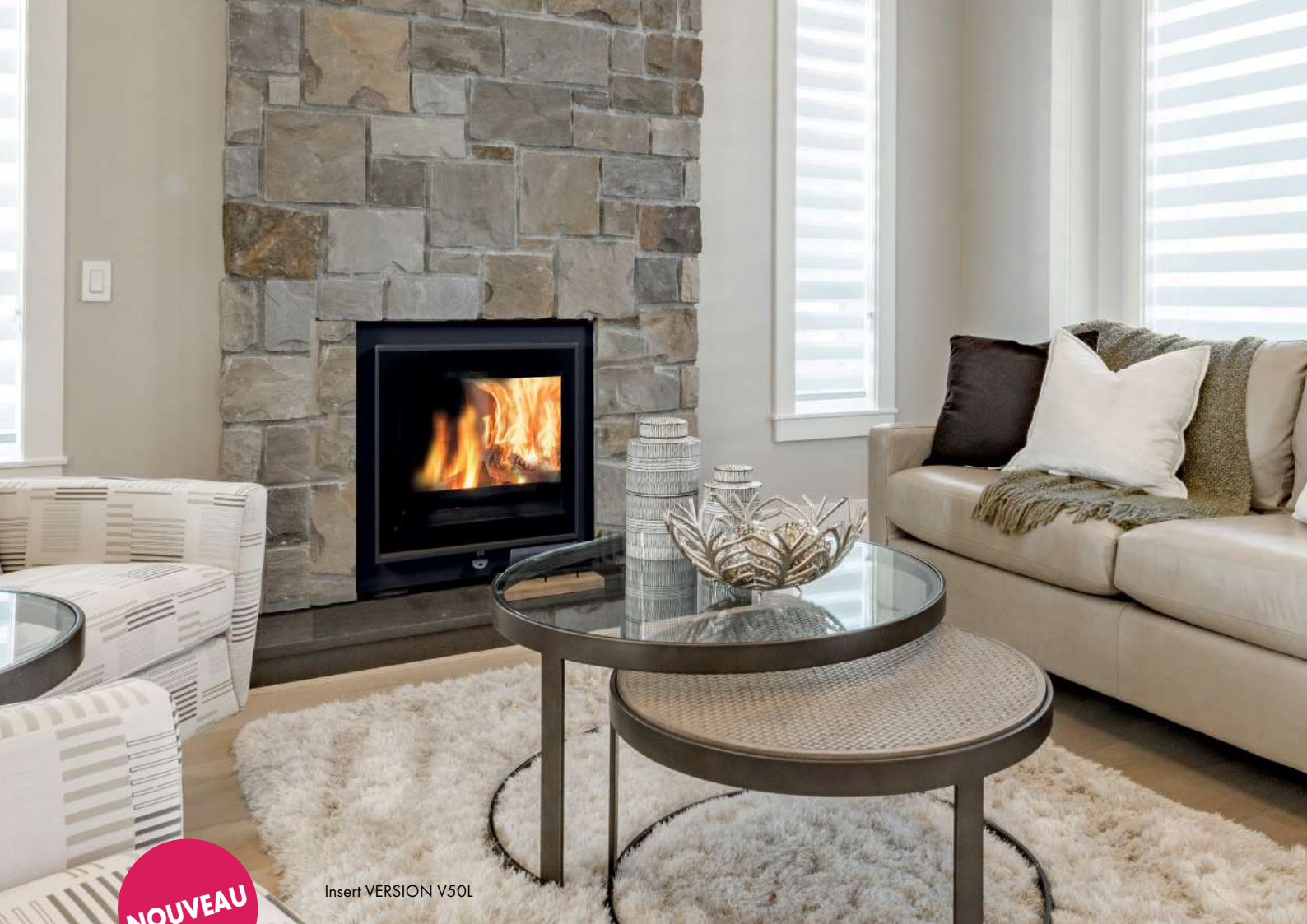
Insert VERSION V50L